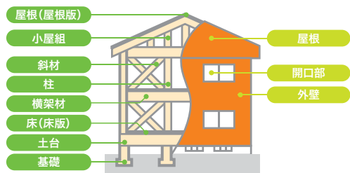
木造 在来軸組工法の戸建住宅の例

構造耐力上主要な部分 雨水の浸入を防止する部分 2階建ての場合の骨組み(小屋組、軸組、床組)等の構成